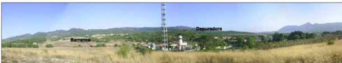
Visual 1.- desde la carretera hacia el barranco