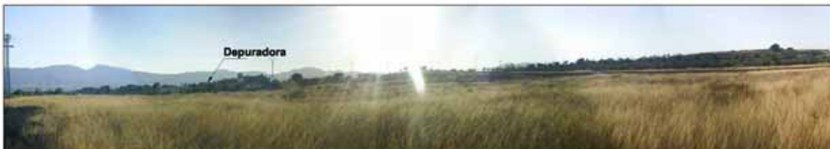
Visual 2.- desde el barranco hacia la carretera